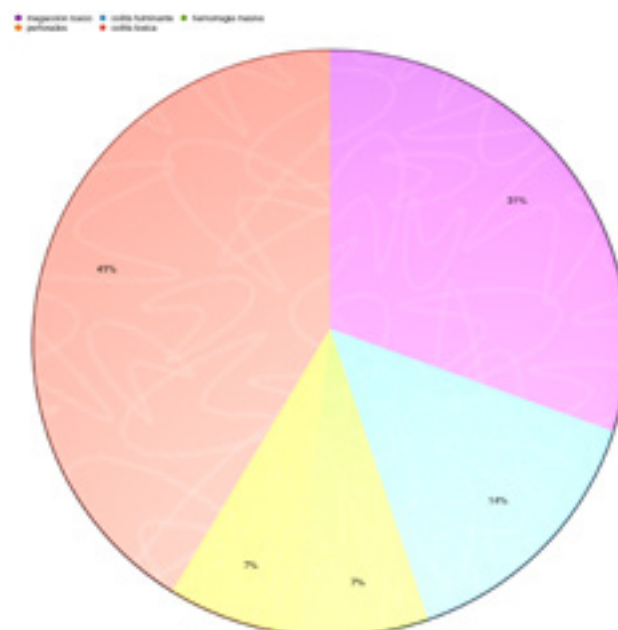
Esquema 1: Indicaciones de cirugía en la urgencia en Hospital Bonorino Udaondo

Para evaluar la evolución del cuadro agudo se consideran marcadores clínicos de respuesta el número de deposiciones y temperatura corporal, marcadores biológicos como los valores de proteína C reactiva, eritrosedimentación y los resultados de los métodos por imágenes: apariencia endoscópica y radiología. En cuanto a esta última, se podrá