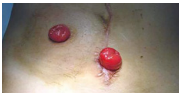
Foto 55: Imagen de cabo suprapúbico evertido.