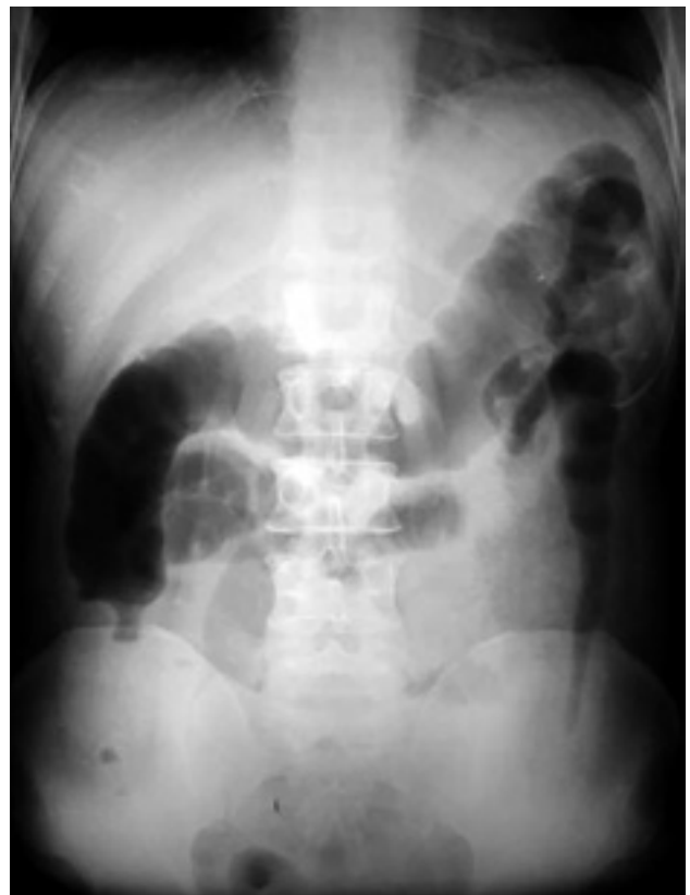
Foto 52: Radiografía de abdomen donde se observa dilatación colónica y asas de delgado en hipocondrio izquierdo.

La presencia de gas en la pared intestinal o fuera de esta indica una perforación bloqueada que se observa en el 30% de los casos, alcanzando una mortalidad del 27 al 60%. 9,14 Heppell y cols. en un estudio sobre 70 pacientes con megacolon tóxico, encontró un 11% de mortalidad global, al dividir aquellos pacientes que pre-